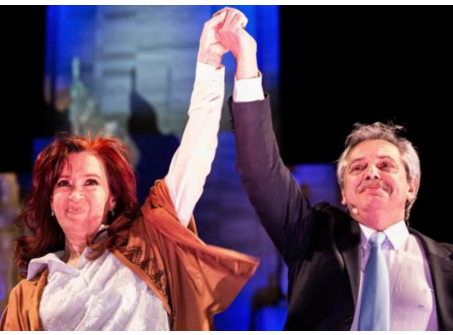
Cristina Fernández y Alberto Fernández.

¿QUÉ PASÓ?: Los electores podían votar entre diez bloques, pero la pelea dura estaba solo entre dos: la coalición oficialista, “Juntos por el Cambio”, y la alianza kirchnerista “Frente para Todos”. “ Juntos por el Cambio ”, apuesta por la reelección del actual Presidente Mauricio Macri, mientras que “ Frente para Todos ”, propone como presidente al ex jefe de gabinete de los gobiernos kirchneristas, Alberto Fernández, y como vicepresidenta a la ex Mandataria, Cristina Fernández.