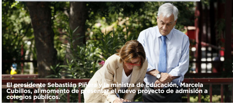
El presidente Sebastián Piñera y la ministra de Educación, Marcela Cubillos, al momento de presentar el nuevo proyecto de admisión a colegios públicos.

En el boletín anterior, se explicó la Reforma Laboral y la Reforma al sistema de Pensiones que impulsa el gobierno. Admisión Justa , es otra de las reformas que el gobierno de Sebastián Piñera busca aprobar, esta vez en el área de educación, para modificar la forma de ingresar a los colegios públicos. Este proyecto cambiaría lo aprobado en el gobierno de Michelle Bachelet, en el que por la ley de inclusión se determinó que los establecimientos educacionales no pueden seleccionar a sus alumnos, sino que aplican un sistema de sorteo.