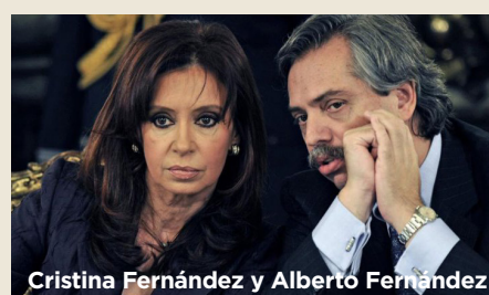
Cristina Fernández y Alberto Fernández

La ex presidenta de Argentina, Cristina Fernández hoy investigada por distintos casos de corrupción, anunció que se presentará como candidata a vicepresidenta en las próximas elecciones presidenciales de su país que se realizarán en octubre. Acompañará al candidato de su colectividad Alberto Fernández, quien postulará a la presidencia. En Argentina la Vicepresidencia conlleva el cargo de presidente del Senado, cargo que ofrece el blindaje de no poder juzgada, lo que es potencialmente muy útil para Cristina Fernández, quien tiene numerosas causas judiciales abiertas.